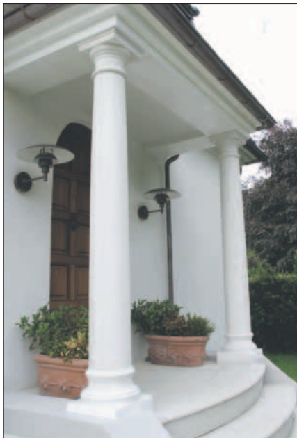
Indgangssøjler i hvid beton