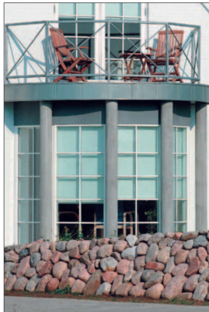
Søjler i beton