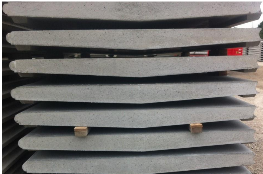
Figur 1 viser placering af træklodser ved rejsning af element.

Ophold under svævende elementer er forbudt og forbundet med livsfare.