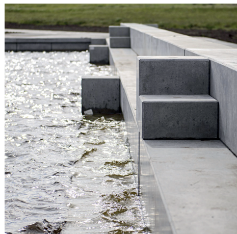
Betonsti med siddetrætter til Naturbydelen i Ringkøbing.