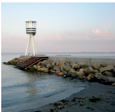
Kystsikring ved Bellevue Strand i København.