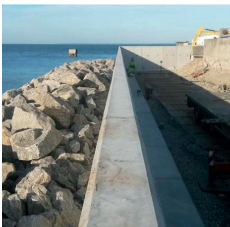
Kystsikring ved Kyndbyværket, Jægerspris.