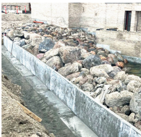
Kystsikring i Tuborg havn Kyst 3 i Hellerup.