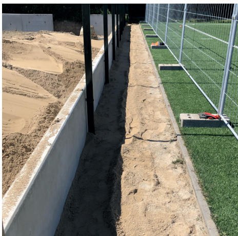
Skybrudssikring af Frederiksberg Idræts-Unions kunstgræs anlæg.