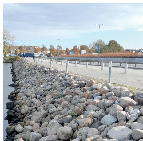
Stormflodssikring af CityCamp Assens Strand, støttemur af L-elementer.

Industri Beton A/S leverer alle typer betonelementer til anlæg, byggeri, infrastruktur, tanksystemer og landbrug.