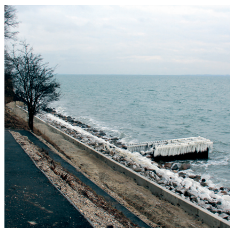
Kyststien ved Springforbi i Taarbæk mellem Dyrehaven og Øresund.