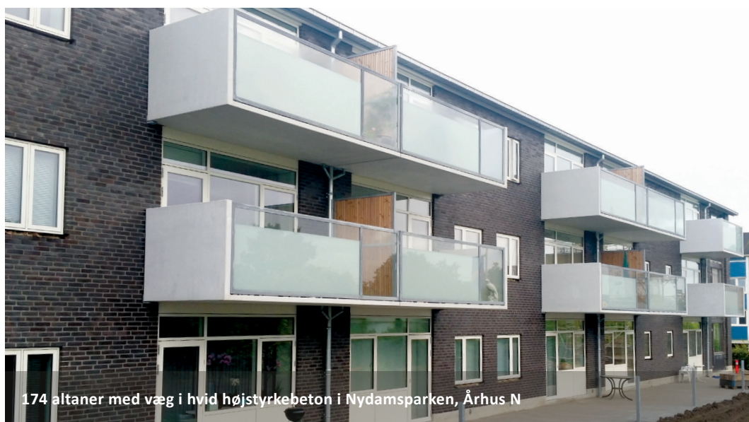
174 altaner med væg i hvid højstyrkebeton i Nydamsparken, Århus N

- tilføj en altan i beton og få et ekstra frirum