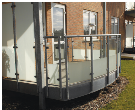
Heimdalsparken i Holstebro Altaner i fiberbeton