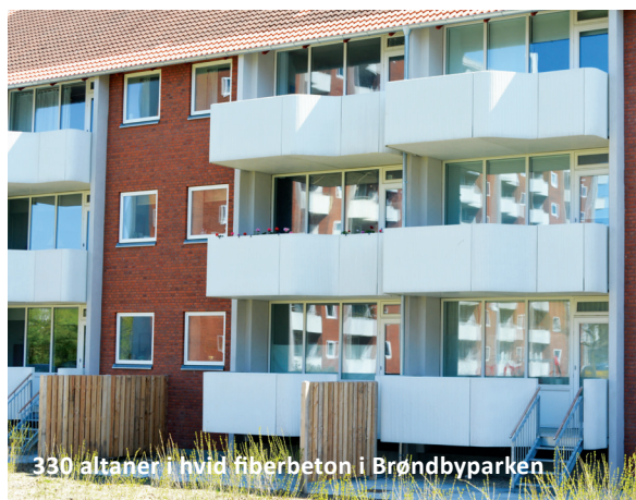
330 altaner i hvid fiberbeton i Brøndbyparken

Har du specielle ønsker til farve eller overflade, så kontakt os.