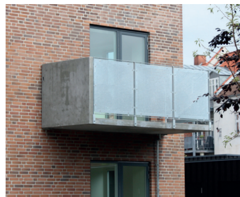
Ryesgade i Horsens Altaner med væg i højstyrkebeton

Industri Beton A/S leverer alle typer betonelementer til byggeriet, både til nye byggeprojekter, til renovering og til ombygning. Vi tilbyder totalleverancer af komplette råhuse - inkl. projektering og montage.