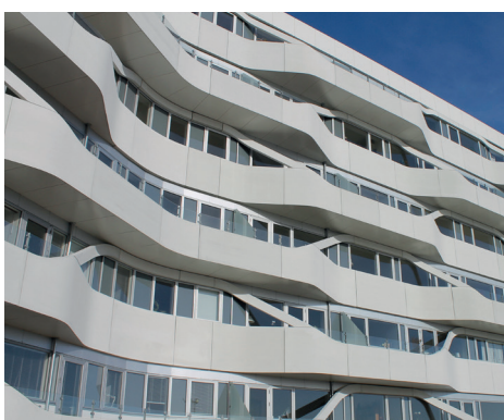
Lighthouse i Aarhus Altaner i højstyrkebeton