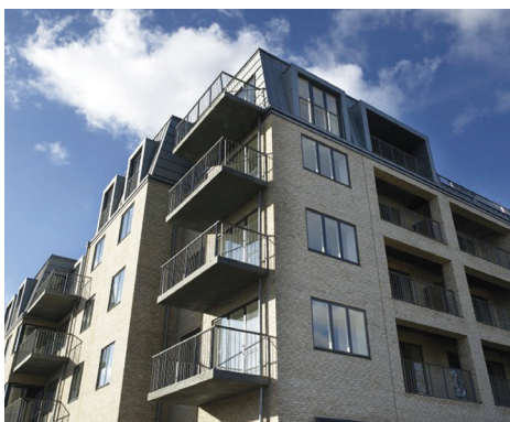
Flintholm Have på Frederiksberg Altaner i blødstøbt beton