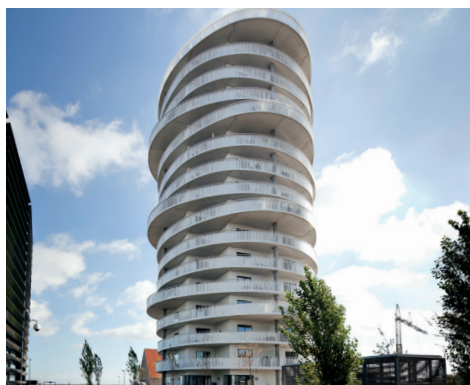
Twister, Amager Strand 150 altaner i 10 varianter