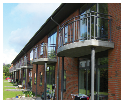
Remisen i Odense Altaner i blødstøbt beton