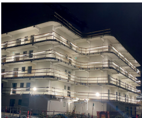
Ørnegårdsvej i Gentofte 1.128 m 2 altangange