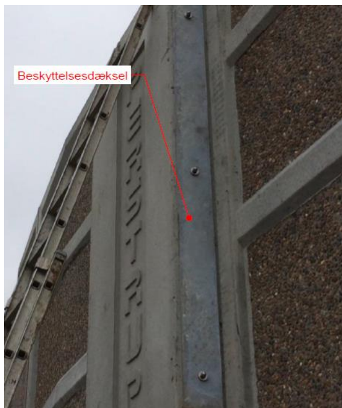
Figur 3 viser spændelementets beskyttelsesdæksel, hvor låse er placeret bagved.

Ved tvivl skal Perstrup Beton Industri A/S kontaktes.