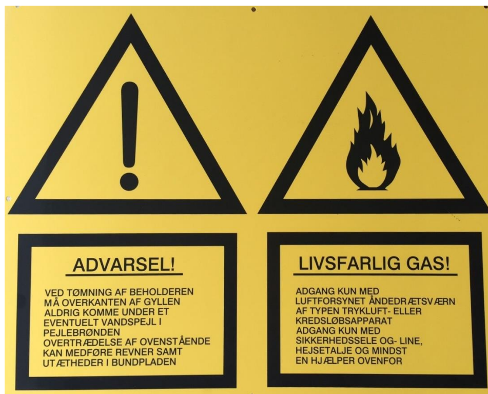
Figur 1 viser skiltning, som skal overholdes.

På gødningsbeholderen er der skiltet med forholdsregler, som SKAL overholdes.