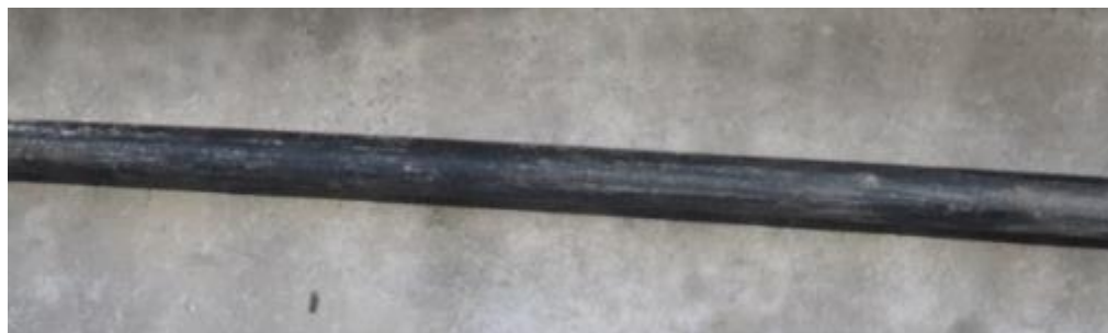
Figur 3 viser billede af line.

Stålwirer inde i linerne er fyldt med omkringliggende fedt. Linerne må ikke bliver udsat for slag eller ridser, så de bliver utætte. Ved utætheder kan fedtet løbe ud, fugt kan trænge ind og stålwirerne kan ruste over.