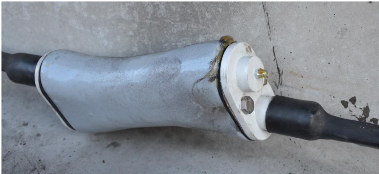
Figur 4 viser billede af Dywidag lås.

En beskadiget line eller en rusten lås kan forårsage utætheder, i værste fald sprængning af beholderen.